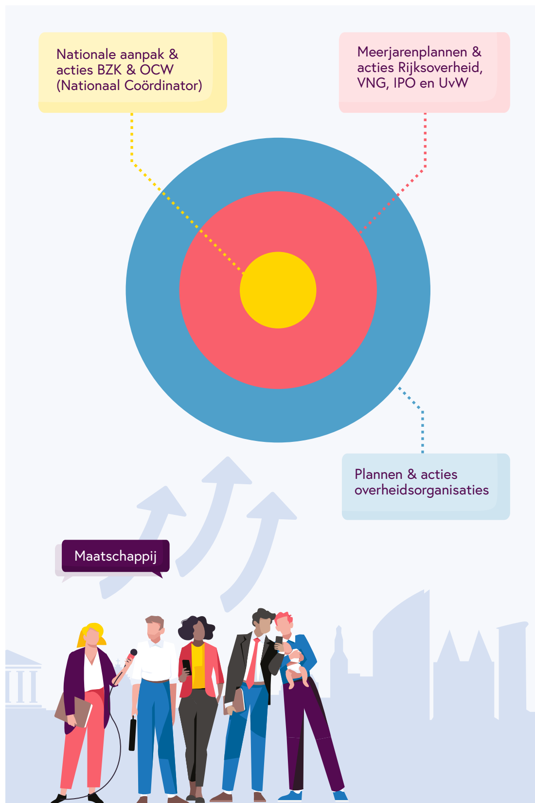
Figuur 1: Gelaagdheid 'meerjarenplan' verbetering openbaarheid en IHH voor de (hele) overheid.